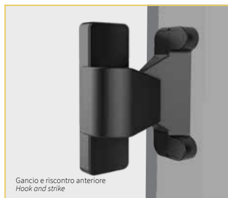
Gancio e riscontro anteriore Hook and strike