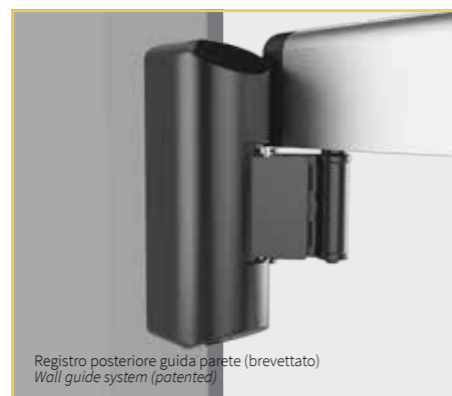
Registro posteriore guida parete (brevettato) Wall guide system (patented)