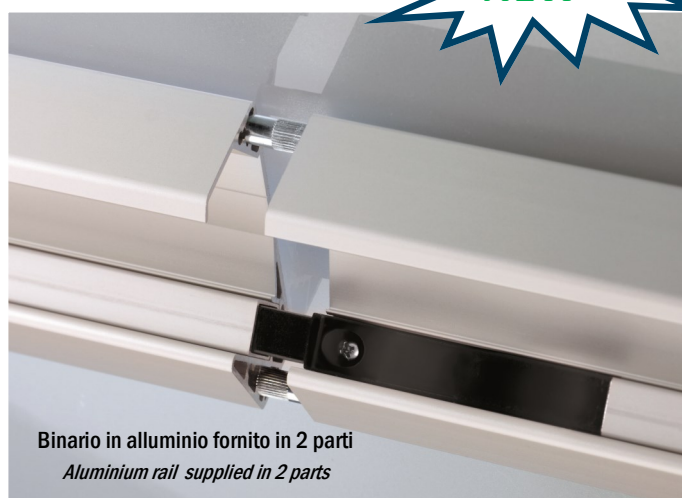
Binario in alluminio fornito in 2 parti Aluminium rail supplied in 2 parts