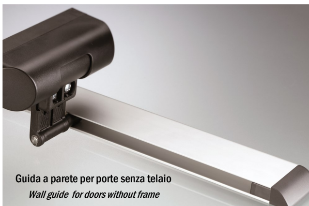
Guida a parete per porte senza telaio Wall guide for doors without frame